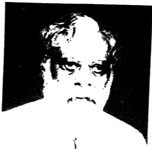
श्रीमत् मठ डालचन्द्र जैन अध्यक्ष